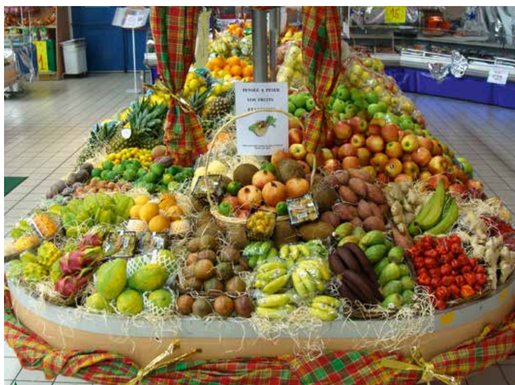
Une offre bien mise en scène suscite la curiosité du consommateur

Cela étant fait, il reste la mise en place de l'opération proprement dite. À ce moment, un certain matériel est indispensable. Dans ce domaine, il n'y a pas de limite à la créativité : palettes avec jupe, charrettes, triporteurs, brouettes, moulins, mannequins grimés en jardinier, bottes de paille, paniers d'osier, végétaux... Tout est bon pour accroître l'ambiance champêtre tant prisée par les consommateurs dans le rayon primeurs. Cet aspect matériel doit, lui aussi être anticipé. Lors de l'implantation proprement dite, une allocation de linéaire juste et précise garantira en plus de ventes optimales, un taux de démarque le plus réduit possible. ■