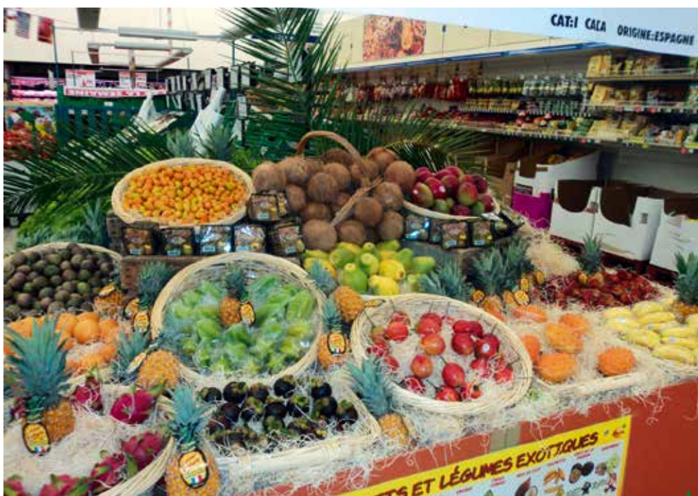
Les exotiques sont propices à une théâtralisation singulière

L'inconstance et la multifréquentation, qui sont devenues une composante majeure des comportements des clients, induisent le besoin d'identité forte. Les raisons différentes pour lesquelles le même client fréquente plusieurs points de vente impliquent en effet qu'il puisse facilement les distinguer. L'aménagement du point de vente mais aussi les techniques de vente et de présentation participent fortement à ce choix. La théâtralisation de l'offre constitue aussi un élément essentiel de différenciation, elle vise à mettre en place des techniques de présentation et de mise en avant des fruits et légumes qui favorisent la rencontre produit-client. Attirer l'attention, susci-