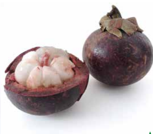
▲ Le ramboutan (à gauche) et le mangoustan

fruit comme le litchi renferme une chair blanche charnue qui adhère à un noyau plus petit que celui du litchi classique. Sa chair est également juteuse et fondante. Sa saveur est un peu moins prononcée que celle de son cousin. Mangoustan et ramboutan sont des fruits non climactériques. Ils ne mûrissent plus après récolte. Ils sont donc cueillis à un stade de maturité relativement avancé. De ce fait, les fruits sont acheminés par avion ce qui contribue à leur prix relativement élevé. Ils sont vendus aux alentours de 7 à 8 euros au stade de gros, en colis de 2 kg ou protégés dans des barquettes filmées de 1 kg.