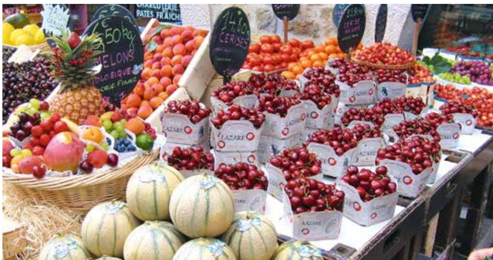
Toute information affichée doit être parfaitement lisible sans induire en erreur le consommateur

Seuls les fruits et légumes dits de 1 re gamme seront traités ci-après. À noter toutefois que les trois « gammes » ainsi définies sont exemptées de la déclaration nutritionnelle rendue obligatoire pour de nombreux produits alimentaires, depuis décembre 2016, par le