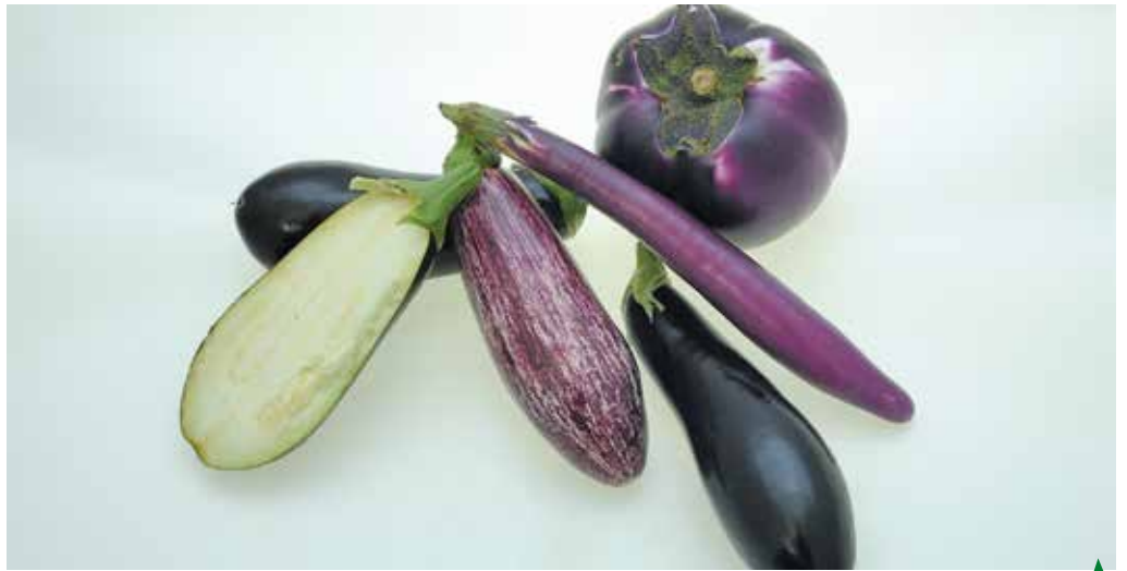
L'aubergine offre des formes, des couleurs et usages variés ▲

La taille, la forme et la couleur de l'aubergine sont très différentes selon les variétés. C'est un légume de très belle apparence avec majoritairement un épiderme noir brillant. Mais il existe également des variétés à la peau blanche, jaune, pourpre ou encore zébrée pour lesquelles la production reste anecdotique. Elles peuvent être rondes, oviformes, globuleuses, oblongues, demi-longues, longues ou encore très longues. Les formes allongées traditionnellement cultivées en zone méditerranéenne ont disparu au profit des formes intermédiaires ou oblongues.