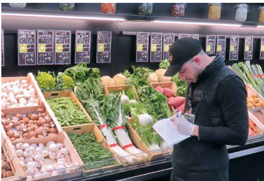
Quand le linéaire est étroit, il faut compenser par un réassort plus fréquent

L' agencement du point de vente doit être au service des produits et services proposés : gammes choisies, innovations de services, praticité d'achat, nouveaux modes de consommation guideront les choix. L'ouverture ou la reprise d'un point de vente de fruits et légumes nécessite une réflexion préalable qui oblige le commerçant : à opter pour un positionnement commercial (standard, qualitatif, de niche, spécialiste ou multispécialiste) ; à vérifier la nature de sa clientèle pour répondre à ses attentes ; à connaître le positionnement de ses principaux concurrents pour affiner sa proposition et se démarquer si nécessaire. Une fois le choix entériné, l'agencement de la surface de vente doit se construire autour de l'identité du magasin, de son esthétisme puis intégrer fonctionnalité et confort de travail. Il doit être en phase avec le dimensionnement commercial et financier du projet.