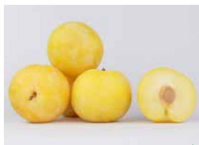
Variété Sun Kiss ▲