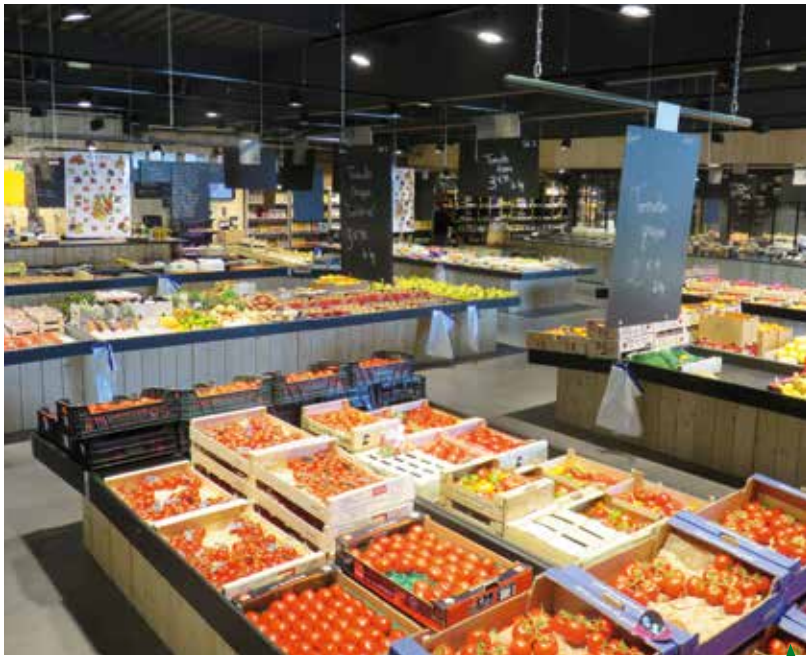
Une stratégie coût-volume nécessite de la profondeur de vente et de larges allées

cyclables. Le bois brut, l'osier ou encore les tons verts seront appropriés. La végétalisation d'espaces et des murs d'eau en circuit fermé pourront être adoptés. De même, l'emploi d'emballages biosourcés est conseillé ; les produits bio et raisonnés seront mis en avant.