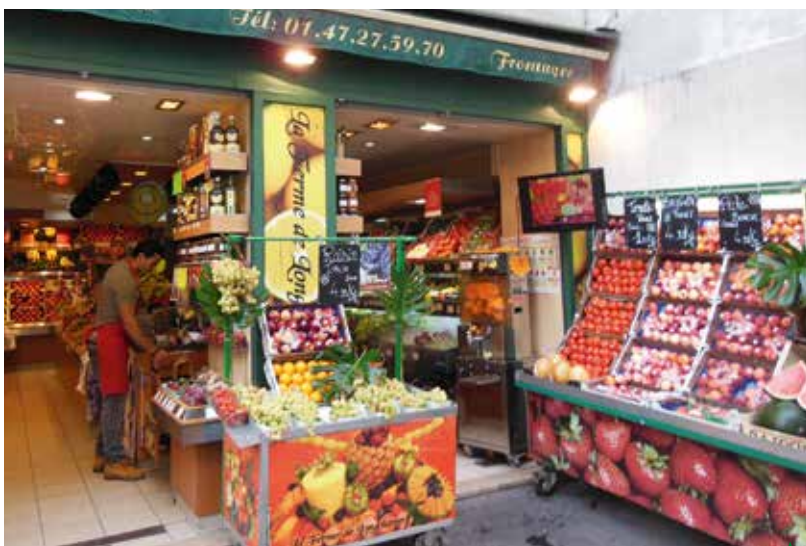
L'exiguïté des lieux oblige le professionnel à exploiter l'extérieur

En cas de doute persistant sur le potentiel du point de vente mieux vaut prévoir des évolutions du concept à dates plutôt que d'investir massivement au départ du projet. L'optimum de chiffre d'affaires d'une activité nécessite parfois trois exercices pour atteindre ses objectifs notamment dans le cas d'une création d'entreprise. ■