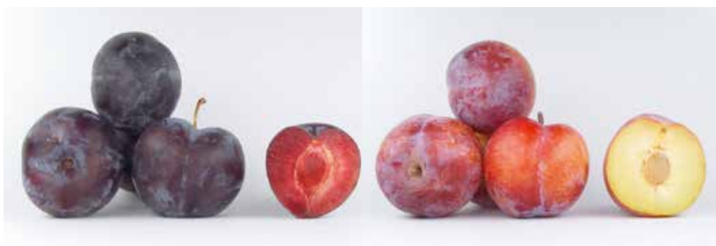
Variétés Primetime (à gauche) et October Sun ▲

Avec une référence en magasin par couleur sur un calendrier plus étendu, la prune pourrait se positionner comme un fruit majeur dans le chiffre d'affaires du rayon. De nombreuses variétés per-