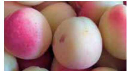
Variété Vanilla Cot®

Il existe une multitude de variétés d'abricots. On dénombre pas moins de 80 variétés différentes, développées au fil des années, multipliant les textures et les saveurs mais aussi les possibilités de consommation. En effet, l'abricot est présent sur les étals tout l'été grâce à une large gamme variétale composée de variétés précoces, de saison et tardives.