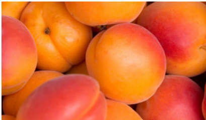
Variété Rouge du Roussillon (de saison)