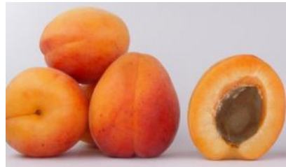
Variété Orangered (précoce)

Il existe bien d'autres variétés parmi lesquelles on peut citer Early Blush®, Bergarouge® ou encore Vanilla Cot® (ci-dessus).