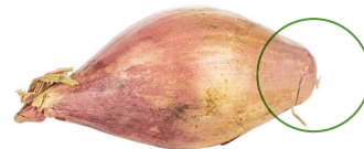
Échalote de semis sans cicatrice de plateau