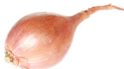
L'échalote rose (Jersey)